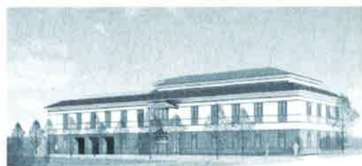
新学生集会所完成予想図(京都大学)

京都大学同窓会とご相談し、11月7日(土)第10回ホームカミングディにおける記念音楽会出演と新学生集会所見学を企画中です。大学内の組織決定がまだ終了していませんので、内定段階ですが、つぎに記念音楽会、新学生集会所見学、お祝いの会についてご案内します。